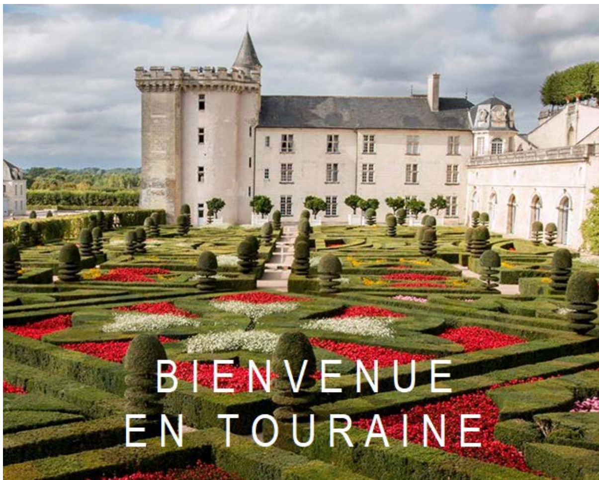
Château de Villandry

Tours – Val de Loire du 6 octobre au 9 octobre 2021